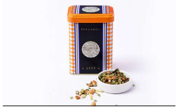
Relax Çayı RELAX TEA