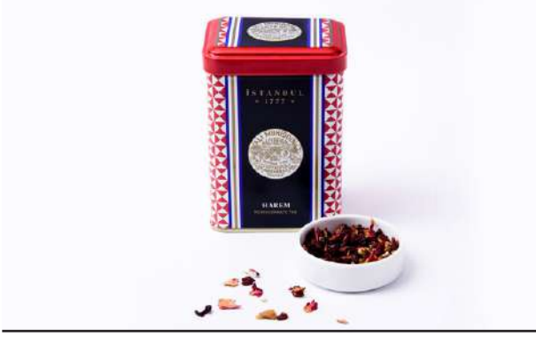
Harem Nar Çayı HAREM POMEGRANATE TEA