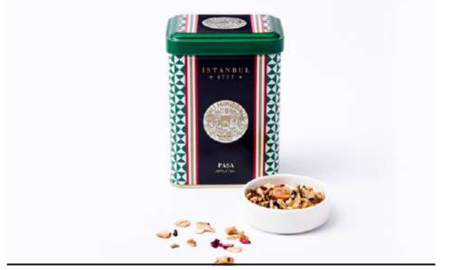
Paşa Meyveli Elma Çayı PAŞA APPLE TEA