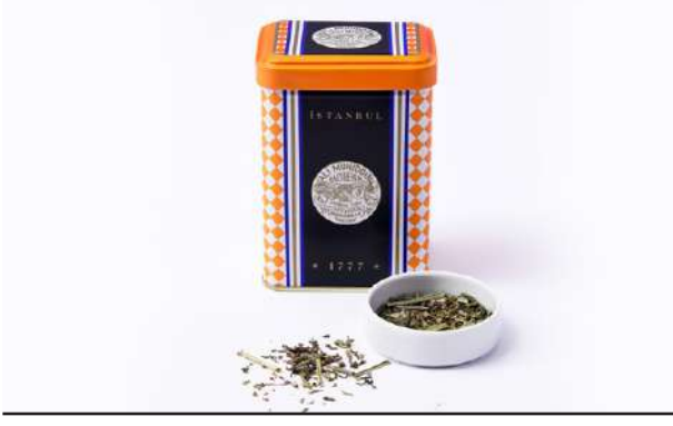
Nane - Limonlu Türk Yeşil Çayı MINT LEMON WINTER GREEN TEA